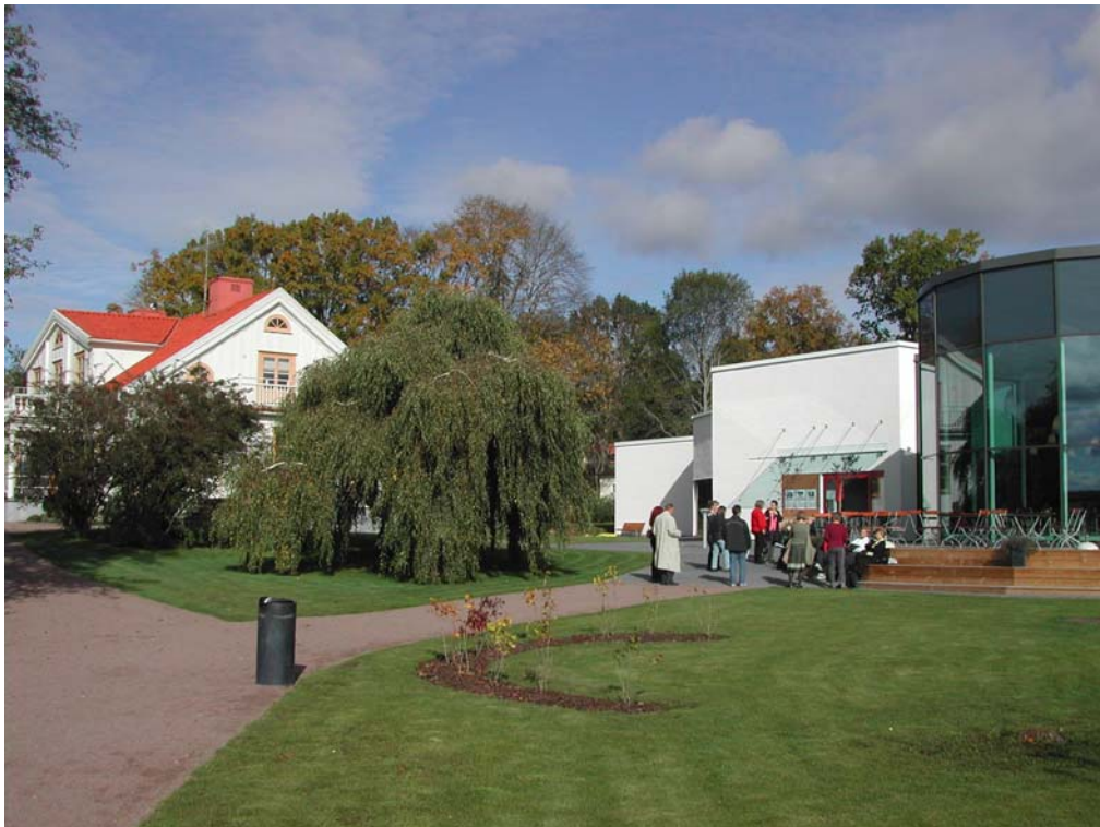
Nybyggnationen och prästgården vid Astrid Lindgrens Näs.

I år skulle Astrid Lindgren ha fyllt 100 år. 100-års jubileet uppmärksammas med en rad olika aktiviteter runt om i landet. På Kungliga biblioteket i Stockholm visas exempelvis utställningen ”Astrid Lindgren som opinionsbildare”, baserat på material ur Astrid Lindgrens privatarkiv. Arkivet, som förvaras på biblioteket, beräknas fylla mer än 125 hyllmeter och är förmodligen det mest omfattande arkiv som en enskild svensk har lämnat efter sig. I brev, manuskript, fotografier och tidningsartiklar speglas mer än 60 år av hennes verksamhet. Vill man däremot söka ursprunget till Astrid Lindgrens författarskap får man bege sig till Vimmerby och hennes barndomshem Näs.