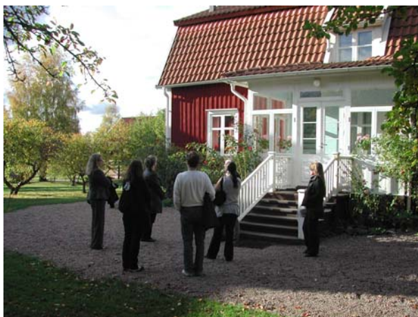
Astrid Lindgrens barndomshem.

Det var också på Näs som Arkivpedagogisk forum valde att förlägga höstens seminarium ”Att levandegöra vårt kulturarv”. Under dagens serverades, förutom Astrid Lindgrens jubileumskakor, smakprov på hur olika kulturarvsinstitutioner i samarbete med skolor kan levandegöra historien med hjälp av tidsresor, dramaövningar, film, utställningar, arkivlådor och skönlitteratur.